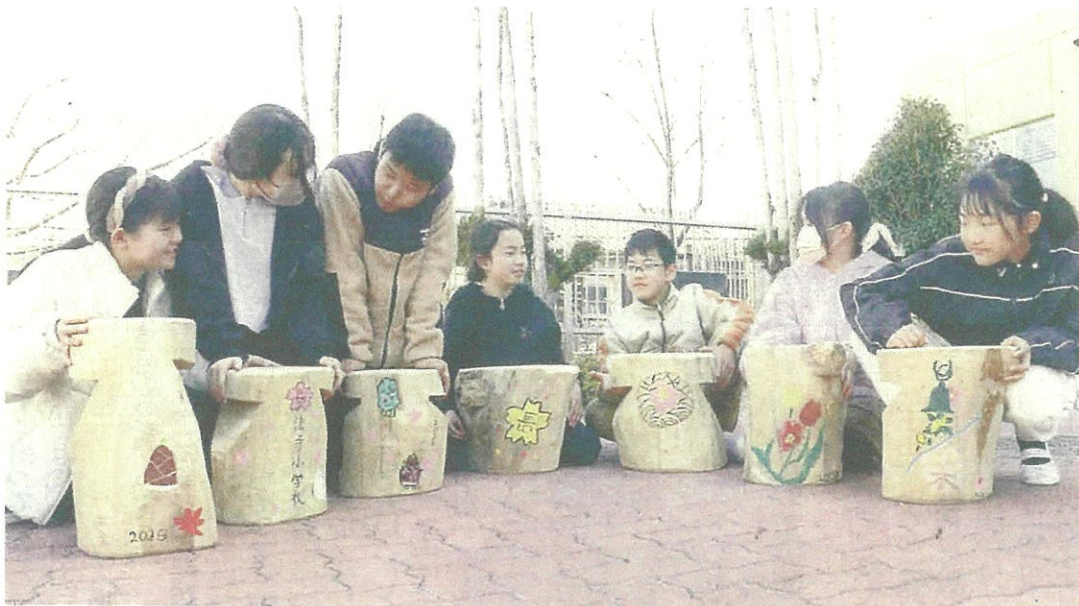
校内にあったクスノキを使って児童たちが作った丸太いす (長岡京市・長法寺小)

クスノキは樹齢30年以上と、年創立の創立100年記念みられ、長法寺小（1872）で植えられたとも伝わる。高